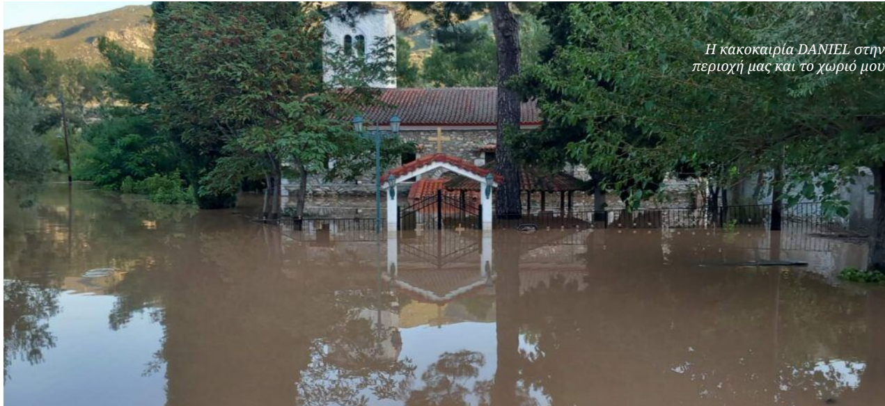
Η κακοκαιρία DANIEL στην περιοχή μας και το χωριό μου.

Η εμπειρία του DANIEL μέσα από τα μάτια ενός παιδιού.